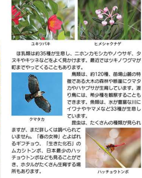
ユキツバキ ヒメジャクナグサ クマタカ ハッチョウトンボ

苗場山麓には、とてもたくさんの生きものがいます。とくに植物は、生きた植物園といわれるほどで約1,300種が生きています。雪の中に埋もれることで生きられるユキツバキ、苗場山や小松原の高層湿原に咲くヒメジャクナグサやツグクサ、風穴の周辺のみ生ずる希少なエモシグサやエソヒョウタンボク、トチノキの原生林などを見ることができます。