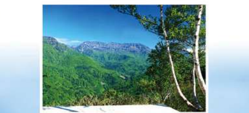
ジオサイトNo.32 苗場山(前倉トド展望台 Map D-4より)

苗場山麓ジオパークでは、地球規模の気候変動と中津川のはたらきによって、およそ40万年前につくられた日本有数の階段状の地形（河岸段丘）を一望することができます。さらに、苗場山や鳥甲山の溶岩からなる見る者を圧倒する柱状節理の発達した岩壁、風穴やかつて海だった信濃川左岸の地層や地すべり地形など、大地の躍動を体感できるジオサイトがたくさんあります。 この大地に、毎年3〜4mの雪が降り積るといふ多雪環境に適応したたくさんの動植物が生きています。なぜ、この苗場山麓にたくさんの雪が降るようになったのか？それは、三国山地の形成と日本海へ対馬暖流が流れ込んだためと言われます。ユーラシア大陸からの季節風は、日本海を渡る際に暖流による水蒸気を蓄え、三国山地にぶつかって上昇し雪雲となり、たくさんの雪を降らせるのです。