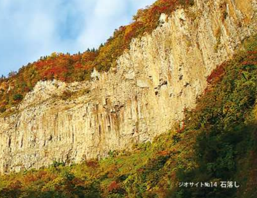
ジオサイトNo.14 石落し

苗場山麓には、とてもたくさんの生きものがいます。とくに植物は、生きた植物園といわれるほどで約1,300種が生きています。雪の中に埋もれることで生きられるユキツバキ、苗場山や小松原の高層湿原に咲くヒメジャクナグサやツグクサ、風穴の周辺のみ生ずる希少なエモシグサやエソヒョウタンボク、トチノキの原生林などを見ることができます。