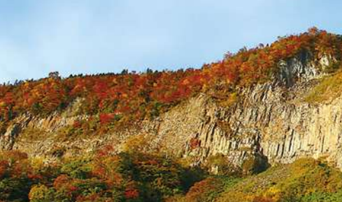
真夏でも3〜4℃の冷気が出てるジオサイトNo.13 山伏山の風穴